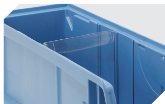
Querteiler CQT für C-Teile-Behälter CTB - mm 53-31303