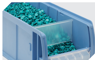
Dosierscheiben CDS für C-Teile-Behälter CTB - mm 53-31304