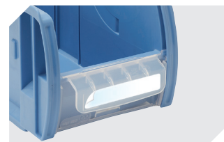
Klebefeldfolien für C-Teile-Behälter CTB - mm 53-31308