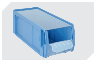
Staubdeckel CSD für C-Teile-Behälter CTB L 369 x B 148 mm 53-31342